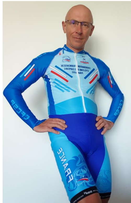
Combinaison de la tenue contre la montre

Depuis le 1 er janvier 2018, le partenariat avec la Sté Decoux Sport à Parthenay (Deux Sèvres) qui gère notre boutique du cyclisme de la CFCSP.