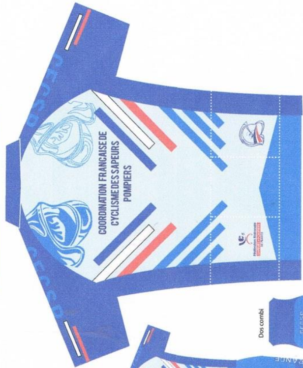
Maillots ou Vestes