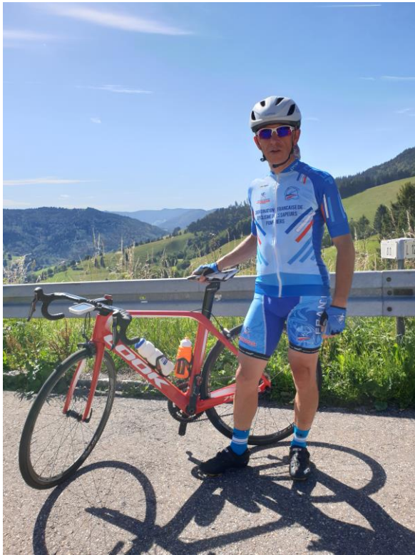
Maillot et cuissard

La boutique du Cyclisme de la CFCSP 2020-2021 Vous propose sa nouvelle collection