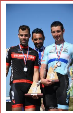
Les podiums des Seniors I et II, les remerciements aux organisateurs et passage de témoin dans le Jura en 2020.

Coordination Française de Cyclisme des Sapeurs-Pompiers (CFCSP) Siège social : 12, rue Saulnier 78410 BOUAFLE (France) Tél. 01.30.95.50.67 - 06.14.20.79.10 Martel.cocmef@orange.fr - www.cfscsp.fr Blog: cfscsp-cicsp.over-blog.com - https://www.facebook.com/Cfscsp